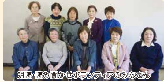
朗読・読み聞かせボランティアのみなさん