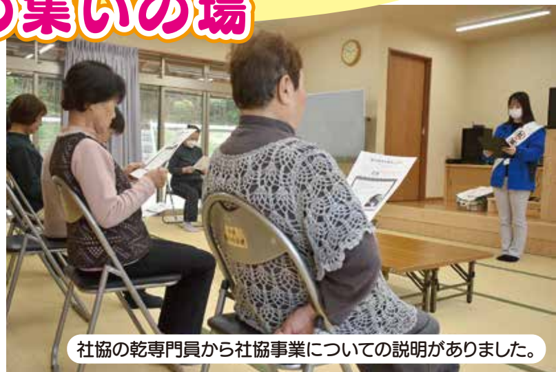
社協の乾専門員から社協事業についての説明がありました。