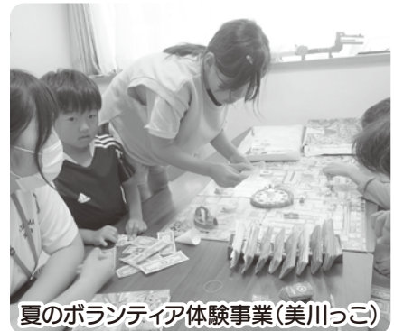
夏のボランティア体験事業（美川っこ）