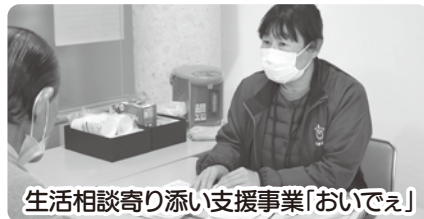
生活相談寄り添い支援事業「おいでえ」