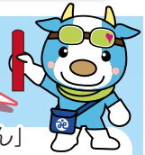
真庭市社協イメージキャラクター「きょうちゃん」

真庭市社協では、北房・久世・勝山・美甘・湯原・萩山地域の「生活支援（地域支援）コーディネーター業務」を真庭市から受託しています。