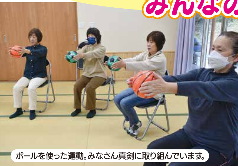
ボールを使った運動。みなさん真剣に取り組んでいます。