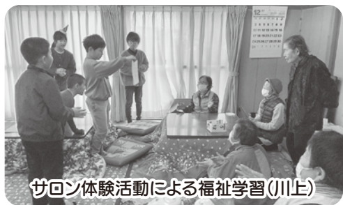
サロン体験活動による福祉学習（川上）

*区分間繰入・繰出金81,358千円を含む。 *事業計画・予算の詳細はHPに掲載しています。