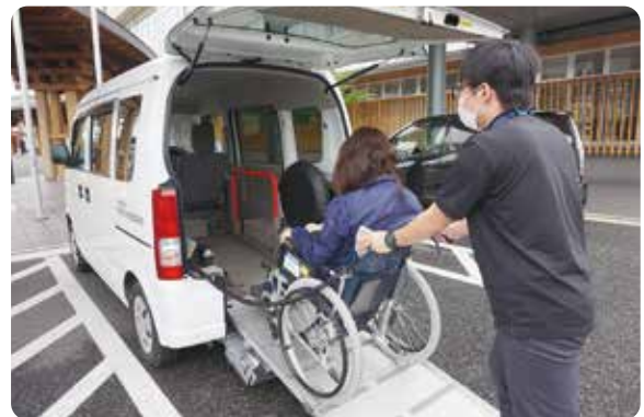
↑車イスに乗ったまま福祉車両に乗車する様子

使用した燃料費をご負担いただきます。車両返却時の給油と清掃、運行日誌のご記入をお願いします。