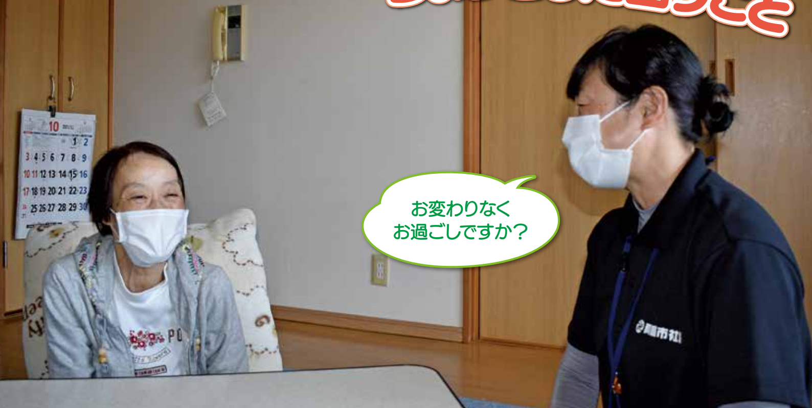
↑ Aさん(左)を訪問する土井福祉活動専門員(右)