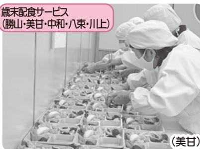
歳末配食サービス (勝山・美甘・中和・八束・川上) (美甘)