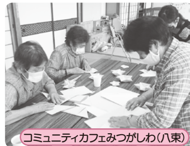
コミュニティカフェみつがしわ(八束)