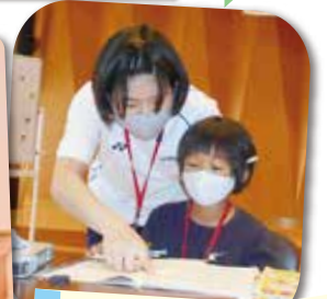
↑「サマースクール」で勉強を教える高校生ボランティア