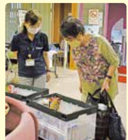
↑日用品を選ぶ参加者

参加者から「家族が長期入院中。普段、なかなか買えないから助かる」、「コロナの影響で解雇され転職。減収があった。ありがたい」との声がありました。