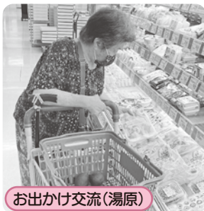
お出かけ交流(湯原)