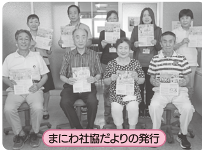
まにわ社協だよりの発行