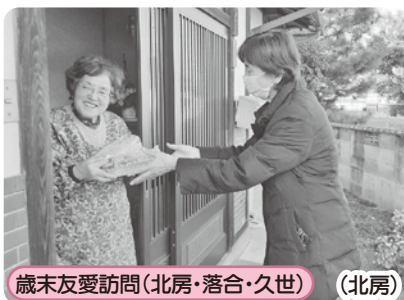
歳末友愛訪問(北房・落合・久世) (北房)