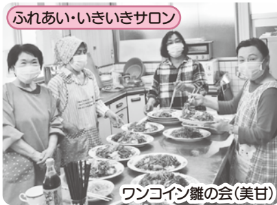
ふれあい・いきいきサロン