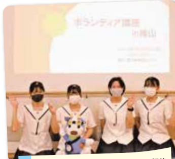
↑ボランティア講座を受講した勝山高校の生徒達